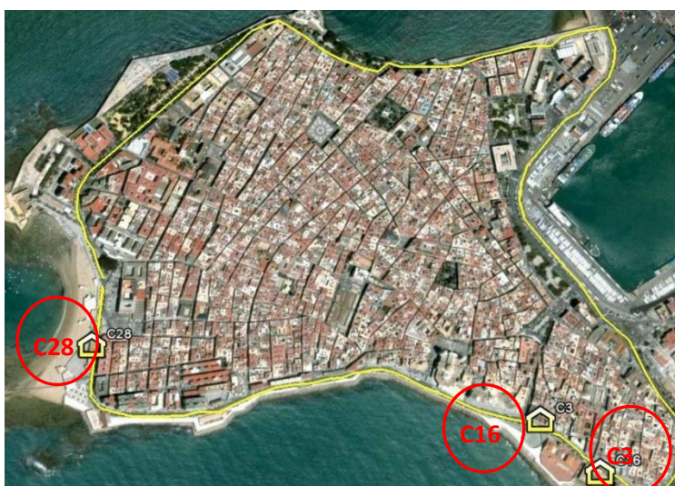
Figura 3: Foto aérea del centro de Cádiz con la ubicación de los colegios C3, C16 y C28 y la vía.

Un dato interesante relativo al colegio C28, situado en la misma vía, es el porcentaje (41,4%) de niños que consideran como ruido más molesto el del tráfico rodado mostrando, las medidas realizadas en este colegio elevados niveles de ruido (77,1 dBA) sufridos por los alumnos. En la Figura 3 se localizan los colegios en color rojo.